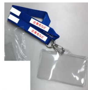
<名札ケース&ストラップの例>