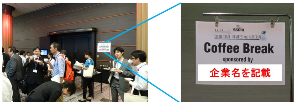
<SSDMでのコーヒーブレイクの様子と掲示看板の例>