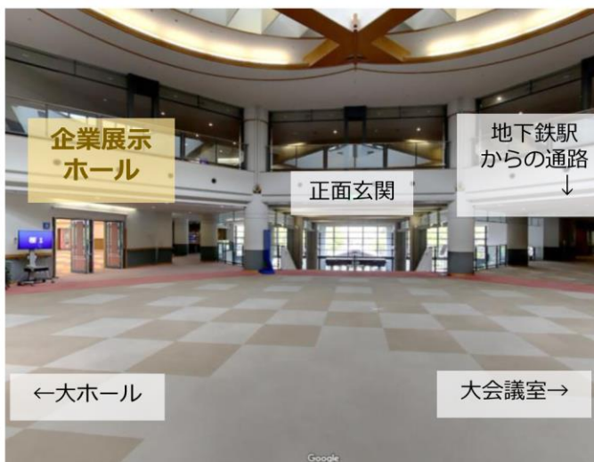
企業展示ホール前のホワイエ